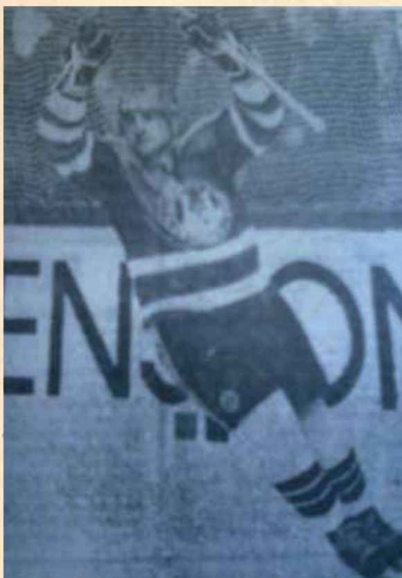
Slovenski as Blaž Lomovšek slavi još jedan pogodak za "medvjede"

Bilo je to romantično doba hokeja u Zagrebu, na Šalatu su dolazile čitave obitelji, grickali su slane perece, pili kuhano vino ili čaj, a ako je bilo snijega nerijetko su se grudali u pauzama između trećina. Čovjeku koji je s rolbom čistio led ta zanimacija publike i nije bila draga jer je bio često metom snježnih kugli. Jednom je čak prekinuo čišćenje usred pola obavljenog posla uzrujan neprestanim grudanjem njega i njegove rolbe.