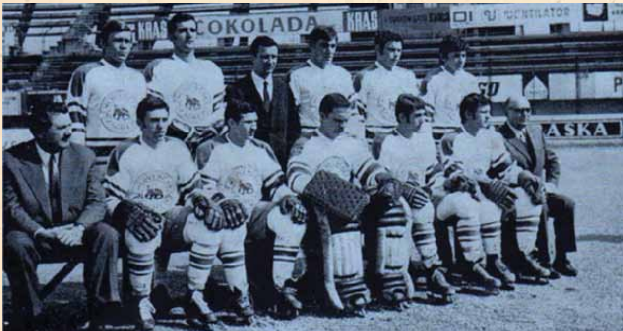
Momčad Medveščaka sedamdesetih godina

Članovi HK Zagreb pristupili su ovom novom klubu jer zbog navedene krize njihov klub nije mogao opstati. Zahvaljujući ovoj fuziji, bivši „zagrebaši“ postaju prvi igrači novoga kluba HK Medveščak. Dok Zagreb nije