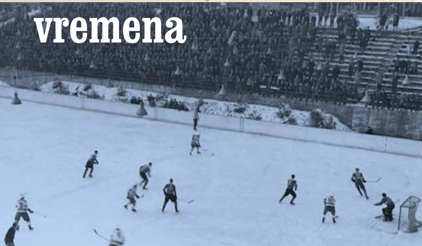
Detalj s utakmice Medveščak- Željezničar (Karlovac) za prvenstvo SR Hrvatske 1961. godine